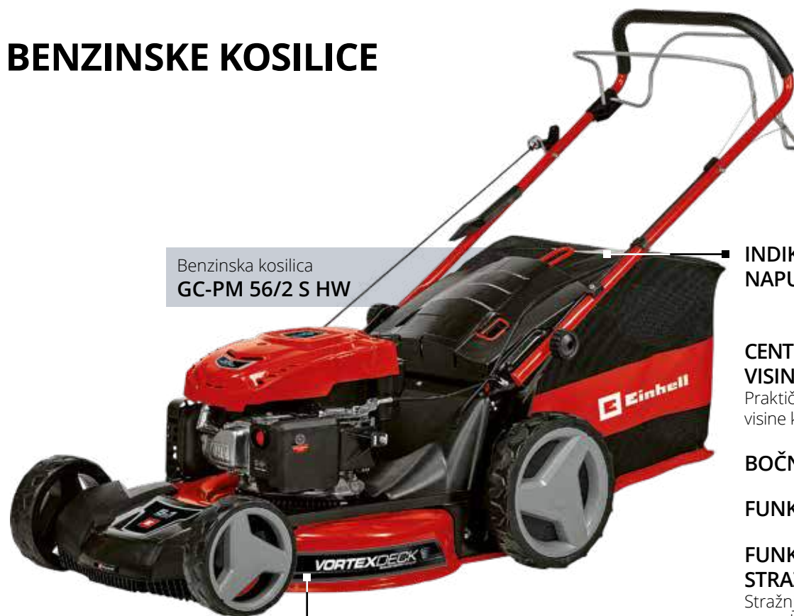
Benzinska kosilica GC-PM 56/2 S HW