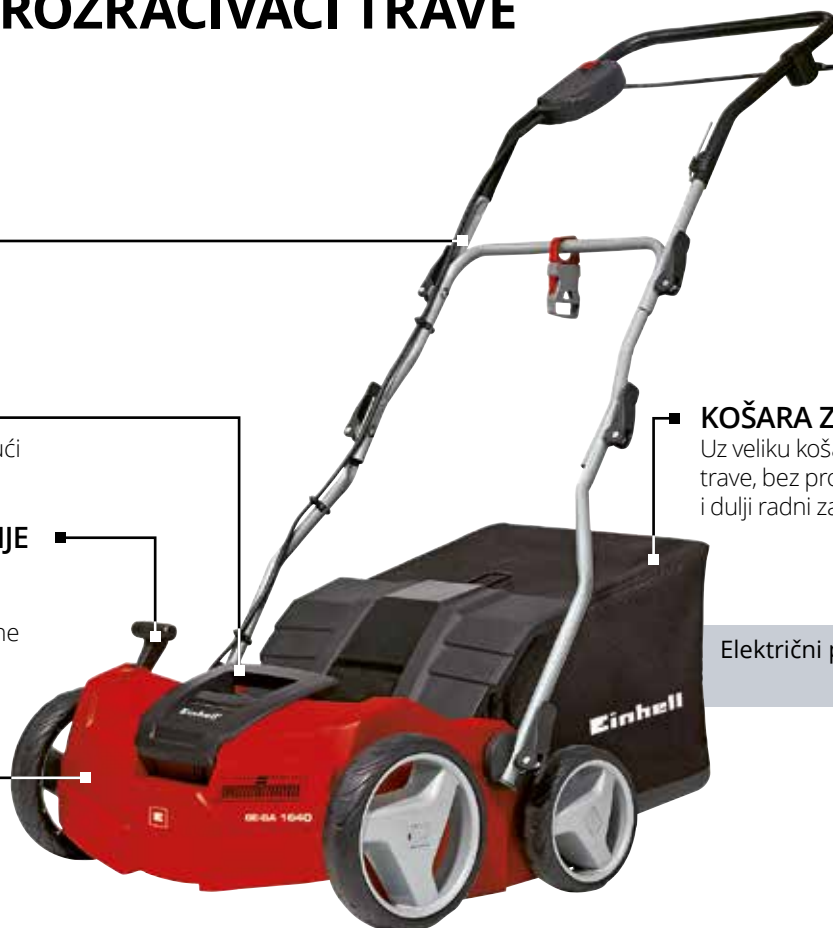
Električni prozračivač trave GE-SA 1640

Uz veliku košaru za sakupljanje trave, bez problema su mogući i dulji radni zadaci